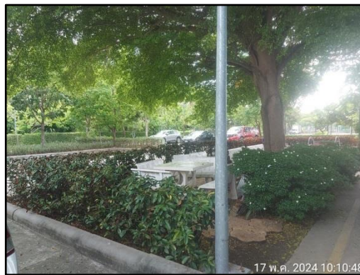
รูปที่ 1-8 พื้นที่สีเขียว