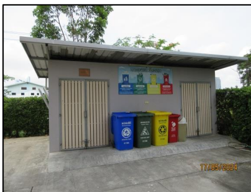
รูปที่ 1-7 ถึงขยะมูลฝอยและห้องพักรวมมูลฝอยภายในโครงการ

โครงการได้กำหนดให้มีการทำความสะอาดห้องพักรวมมูลฝอยของโครงการเป็นประจำสัปดาห์ละ 1 ครั้ง โดยน้ำเสียที่เกิดจากการล้างห้องพักรวมมูลฝอยจะไหลเข้าสู่ระบบบำบัดน้ำเสียรวมของโครงการเพื่อบำบัดน้ำเสียก่อนระบายลงสู่ท่อระบายน้ำริมถนนซอยจรรยวรรขอ 6 บริเวณด้านหน้าพื้นที่โครงการ ดังนั้น การจัดการขยะมูลฝอยของโครงการ จึงส่งผลกระทบต่อสิ่งแวดล้อมในระดับต่ำ