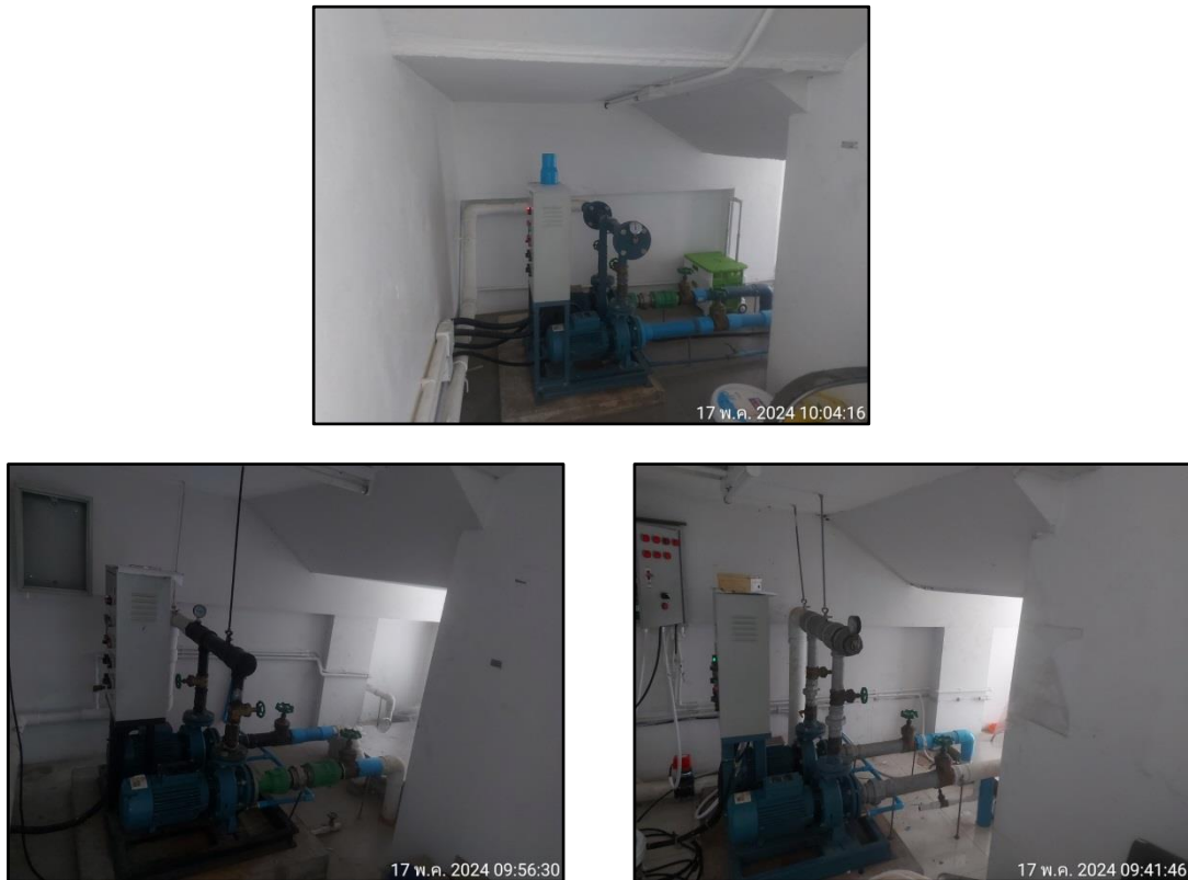
รูปที่ 1-5 ถังเก็บน้ำชั้นใต้ดิน