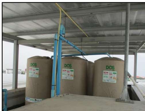
รูปที่ 1-4 ถังเก็บน้ำชั้นดาดฟ้า