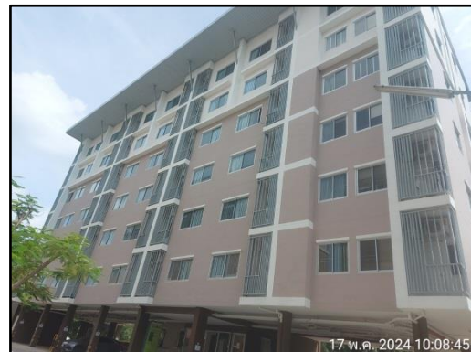
รูปที่ 1-3 ตัวอาคาร